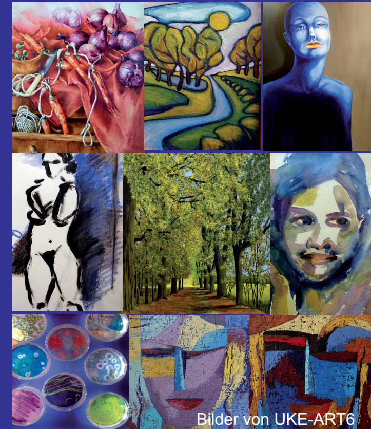
Bilder von UKE-ART6