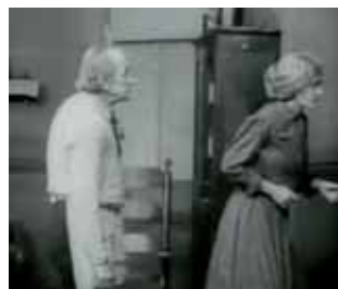
What Shall We Do with Our Old?

Vor fast 100 Jahren drehte D.W. Griffith den Film „What Shall We Do with Our Old?“ Er wird im Beiprogramm in Haus Nr. 25 präsentiert und fachkundig von Heiner Ross kommentiert werden.