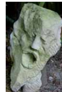
Der Schmerz des Herrn K.