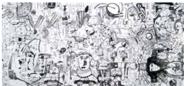
People In einer Gemeinschaftsaktion: Die Maler