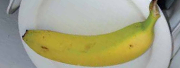
Was passiert, wenn nichts passiert! – Eine Banane ist eine Banane ist eine Banane? Lara Nowotny