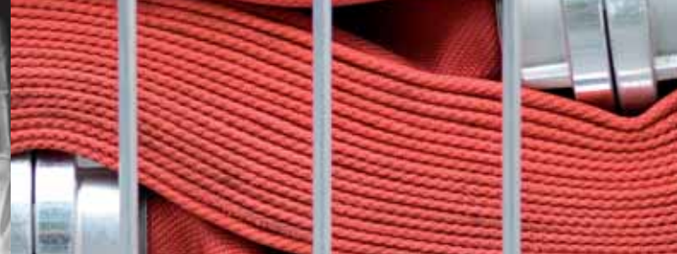
Besser unverändert Thomas Dawideit

Zum 14. Mal öffnen sich wieder private Räume für ein Kunstfestival der anderen Art, den KOTTWITZKeller . 30 Künstler und Künstlerinnen präsentieren an zwei Tagen ihre Statements zum Thema »Unverändert«.